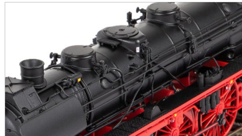
Kessel mit vorbildgerechten Leitungen