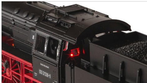
Führerhaus mit Feuerbüchsenflackern